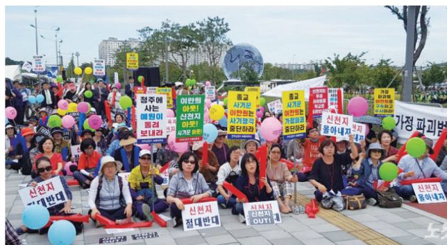
신천지 100억소송(손해배상및정정, 반론보도청구) 대법원 사교집단 신천지의 실체를 폭로한 CBS의 방송내용이 대부분 문제가 없다고 최종 판결